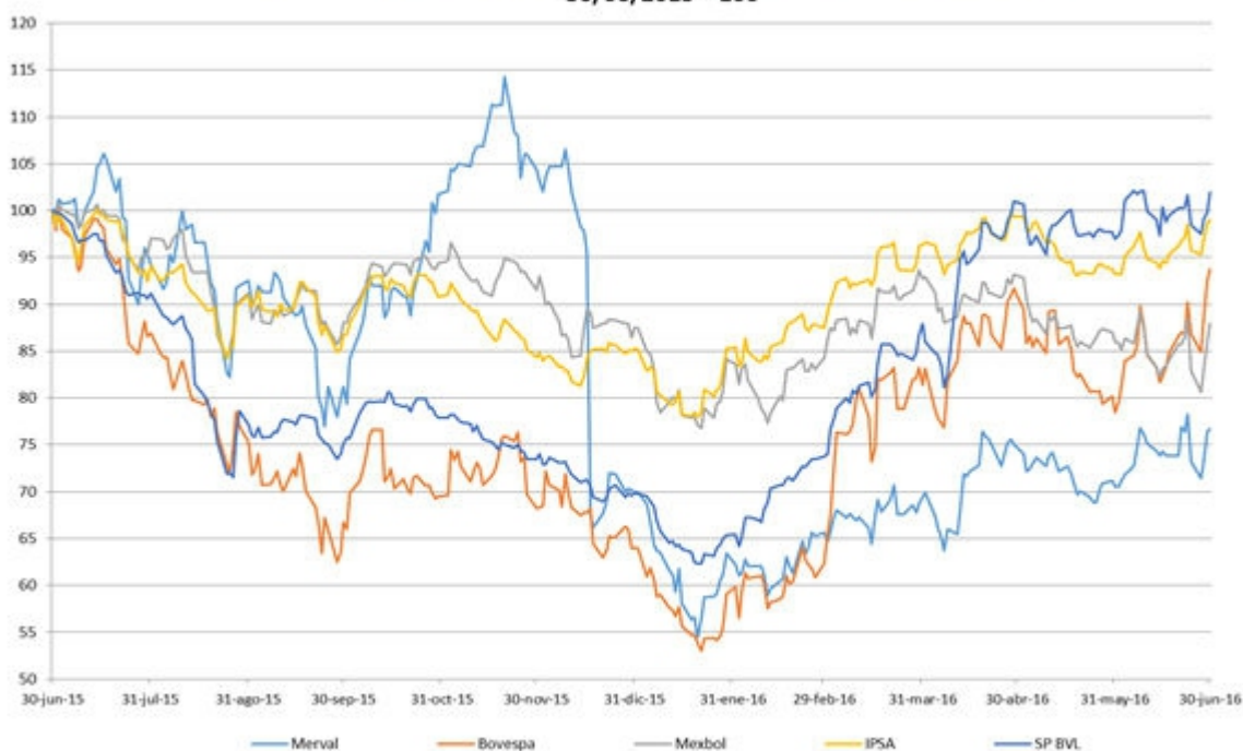
Evolución de Índices bursátiles medidos en USD (Bolsas de Latinoamérica) 30/06/2015 = 100