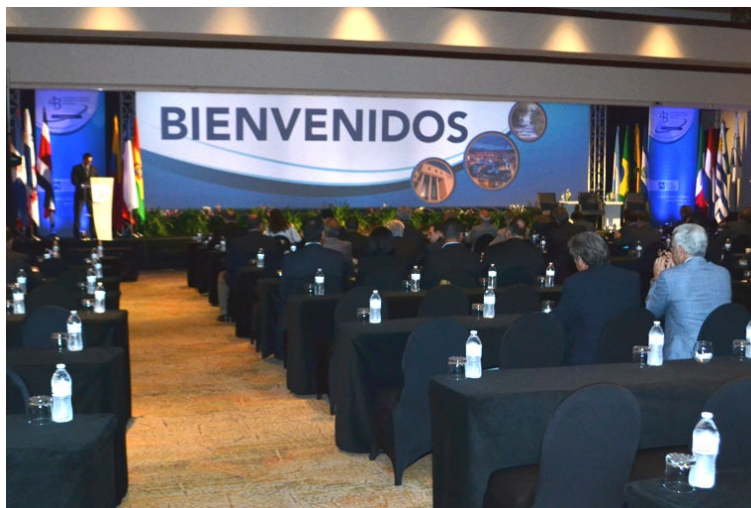
Vista general de la sala de la Reunión Anual