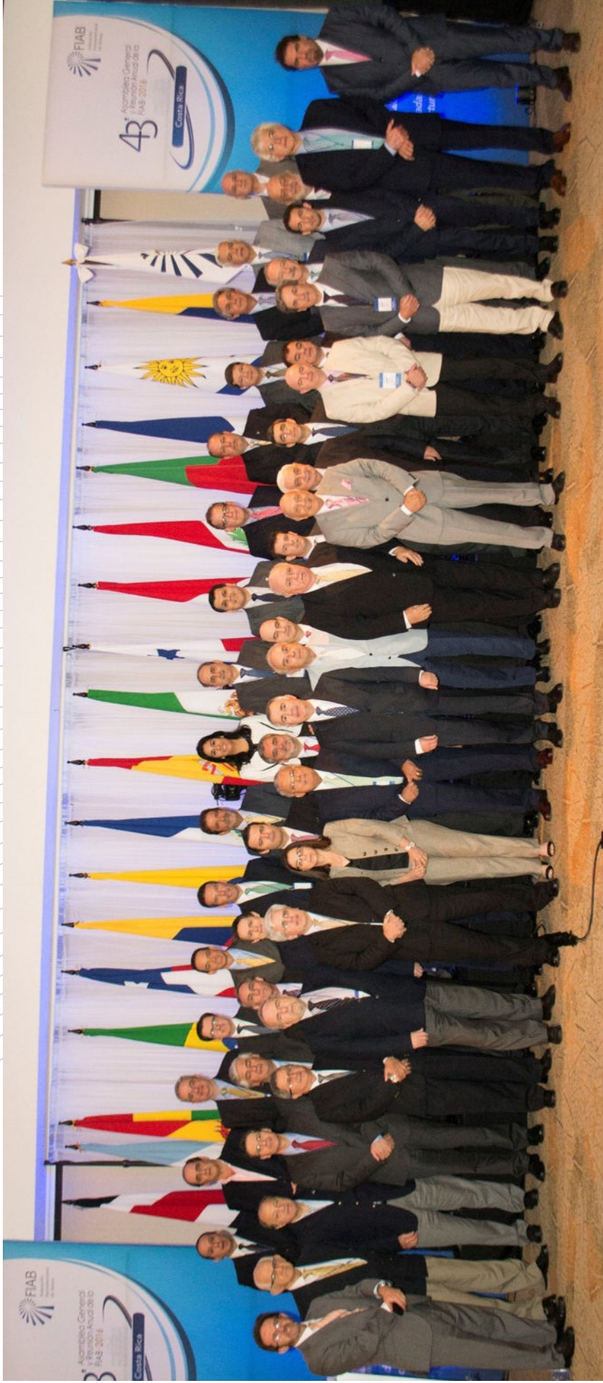
Foto grupal de la 43° Asamblea General Ordinaria de la FIAB Costa Rica, 5 de septiembre de 2016