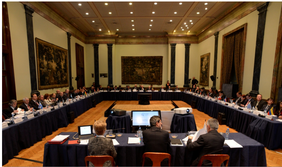
Vista general de la sala de Asamblea

La Bolsa de Valores de Panamá ratifica su invitación (formulada el año pasado y aceptada por la Asamblea General reunida en Santiago de Chile en 2013) para ser anfitriona de la Asamblea del año 2015 en Panamá, en la primera quincena del mes de septiembre.