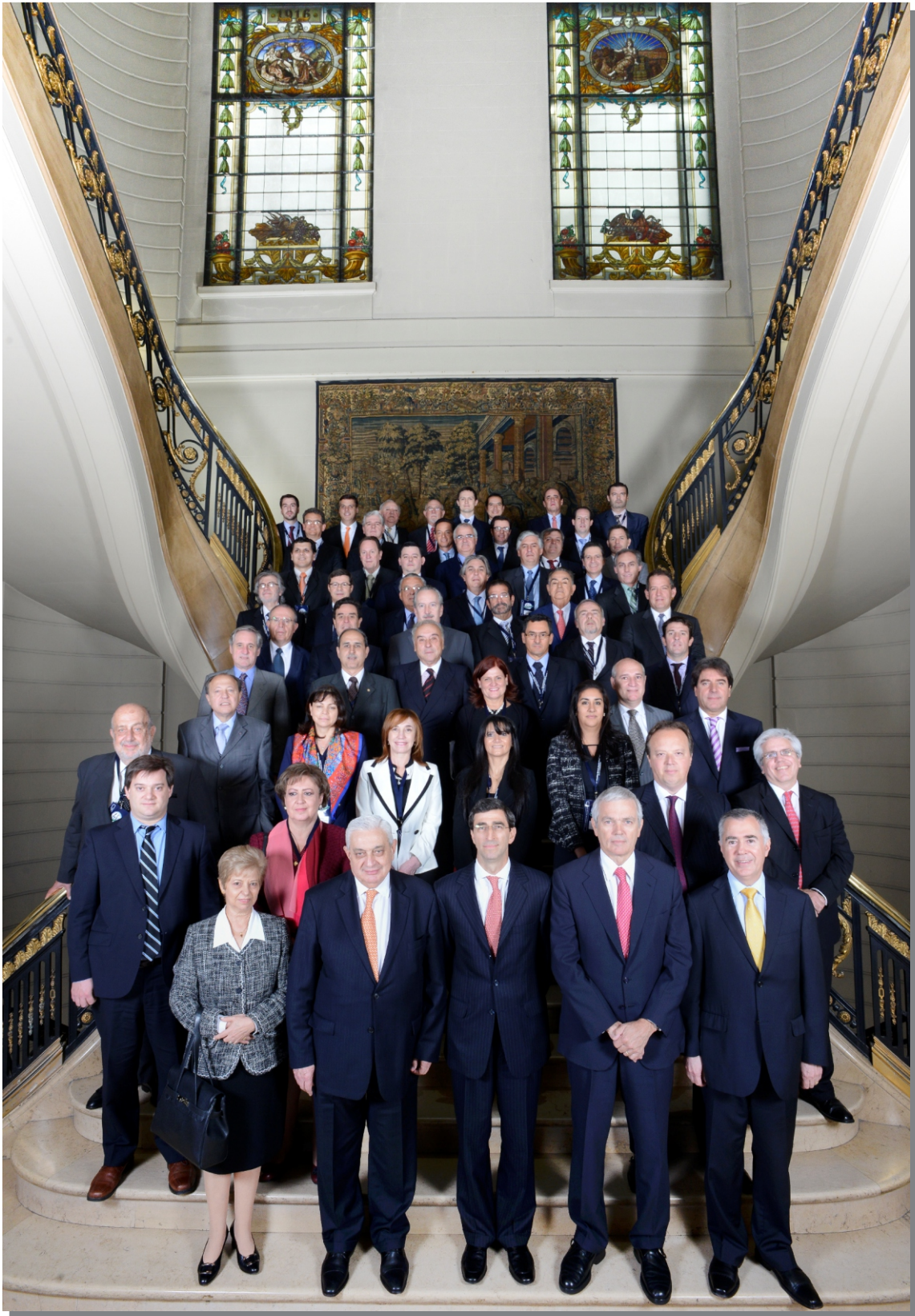
Foto grupal de los delegados de las Bolsas Miembros a la Asamblea General de la FIAB