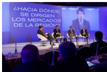
Vista general de la sala durante uno de los paneles

La Reunión Anual de la FIAB tuvo lugar en Santiago de Chile los días 2 y 3 de septiembre de 2013. La Bolsa de Comercio de Santiago fue la anfitriona de esta reunión que se realizó en los salones del Hotel Grand Hyatt.